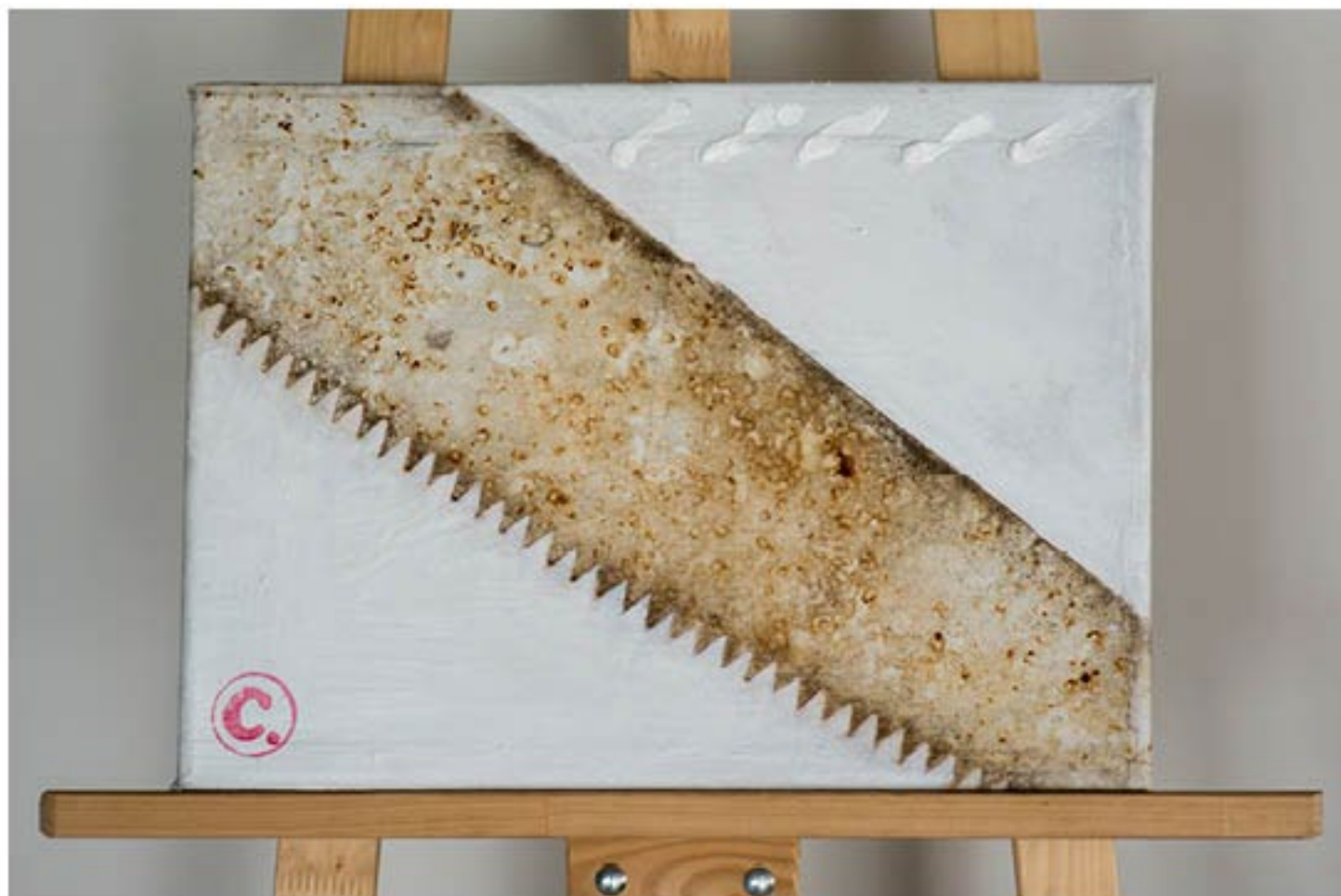
„Piła po przekątnej” z cyklu „Obrazy przetrzynięte” Piotra C. Kowalskiego