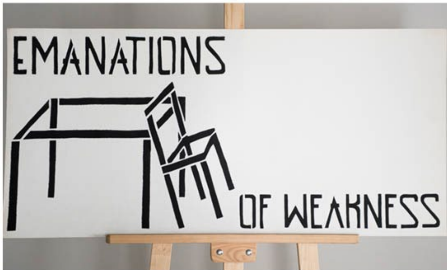
Grafika „Emanations Of Weakness”, grupa Twożywo